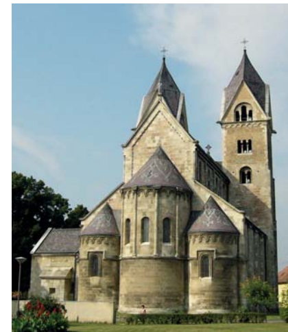
Szent Jakab templom, Lébény

Ki ne hallott volna Santiago de Compostella zarándokairól, az El Camino utasairól, akik az ősi időktől kezdve vágtak neki gyalogszerrel a nagy útnak, hogy lélekben formálódjanak, bűneik kötelékeiből megszabaduljanak, Istennel kiengesztelődjenek, és aztán megtérve és megbékélve térjenek vissza, ki-ki a saját hazájába. A sok-sok évszázad zarándokai megannyi zenei tétellel gazdagították mind magát a zarándokutat, mind pedig a boldog megérkezést. Második koncertünk az út és az érkezés zenei anyagaiból válogat, felölelve megannyi évszázadot, zenei formát és hangzást. Második, téli koncertünk az indulásé, hiszen minden naptári év elején megannyi elhatározással indulunk mi magunk is az új esztendőnek – az úton lévők énekével a minden esztendőben útnak indulók.