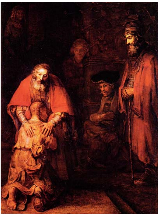
Rembrandt: A tékozló fiú hazatérése (1668-69)