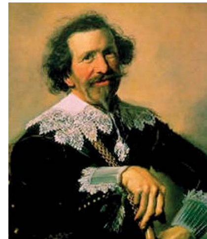
Domenico Mazzocchi arcképe

D omenico Mazzocchi (1592-1665) Monteverdi kortársa, a Római Iskola – némiképp méltatlanul – kevésbé jegyzett zeneszerzői közé tartozik. Egész életét énekesek között töltötte, tisztán hangszeres művéről nem is tudunk. Oratóriumi, motettái ritkán csendülnek föl koncerteken, így harmadik koncertünk egy különleges alkalom: nagybőjt első hetében a “Tékozló fiú” című oratóriumát hallgathatjuk meg néhány nagybőjti motettájának kíséretében, felcsillantva a gregorián irodalomból e nagyszerű művek párhuzamait. Monteverdi az úgynevezett “seconda pratica” szerzői közé tartozott, akik nagy hangsúlyt fektettek a szöveg és a zene érzelmi, hangulati egységére, amelyről, a drámai fordulatokban bővelkedő tékozló fiú történetében személyesen meg is győződhetünk. Harmadik, kora-tavaszi koncertünk a megtérésé a nagybőjt kezdetén: a mennyei Atya már ott áll az úton, – és bennünket is vár.